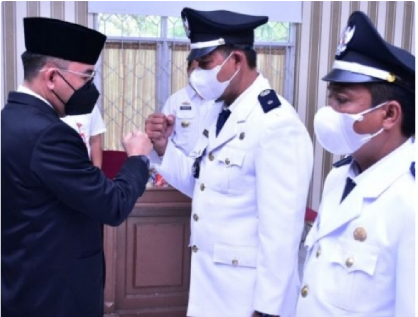
Raden adipati lantik pj kakam dan kakam definitif kec. Rwbang tangkas dan pakuan ratu

Way Kanan -- Sistem Penyelenggaraan Pemerintahan di Indonesia, sesuai dengan UU Nomor 6 Tahun 2014 tentang Desa, maka Pemerintah Kampung sebagai unsur terdepan yang harus mampu memberikan pelayanan kepada